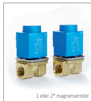
1 eller 2* magnetventiler