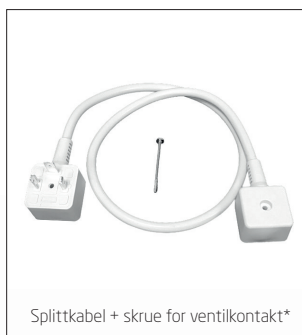
Splittkabel + skrue for ventilkontakt*