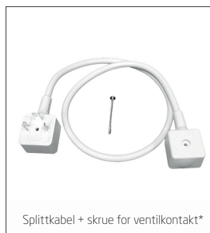
Splittkabel + skrue for ventilkontakt*