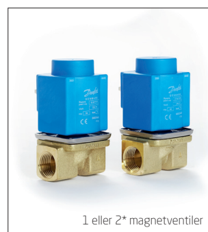
1 eller 2* magnetventiler